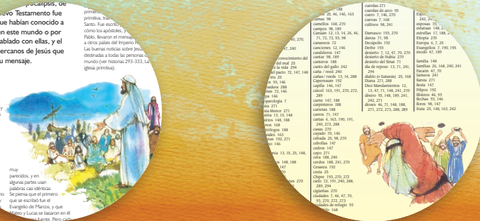
• Artículos de introducción al Antiguo y Nuevo Testamento