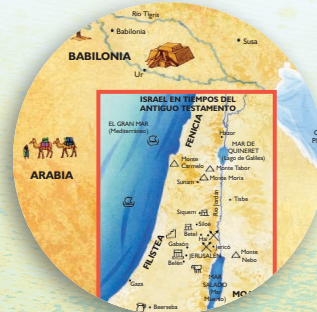
• Mapas y dibujos de los tiempos bíblicos