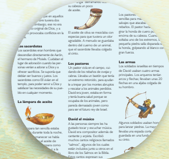
• Datos interesantes y dibujos sobre los lugares y personajes o la época en que vivieron